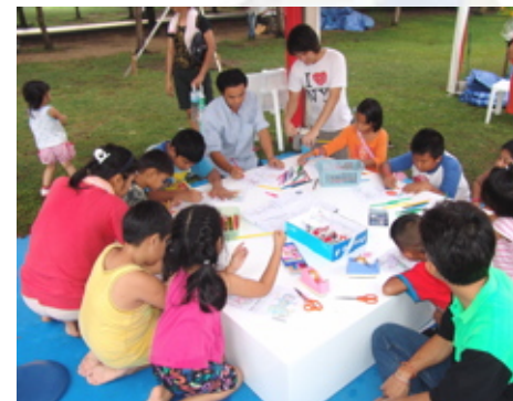
ระบายสีว่าธีออส

บรรยากาศภายในงาน เต็มไปด้วยความสดใส สนุกสนาน และรอยยิ้มของน้องๆ หนูๆ ที่เข้าร่วมกิจกรรม และร่วมถ่ายภาพประทับใจกับที่จิสต้า และที่ธีออสใจดี ที่มาทักทายน้องๆ อบอุ่นบริเวณงาน พร้อมกันนี้ น้องๆ ยังได้รับความรู้ และของที่ระลึกจาก สทอภ. คิดมีกลับบ้านทุกคน