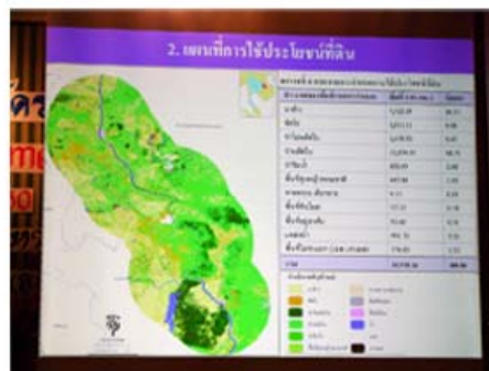
ภาพการนำเสนอผลการดำเนินงาน ของ ศูนย์ภูมิภาคเทคโนโลยีอวกาศ ภาค ตะวันออกเฉียงเหนือ ม.ขอนแก่น โดย ผศ.ดร.ชรัตน์ มงคลสวัสดิ์