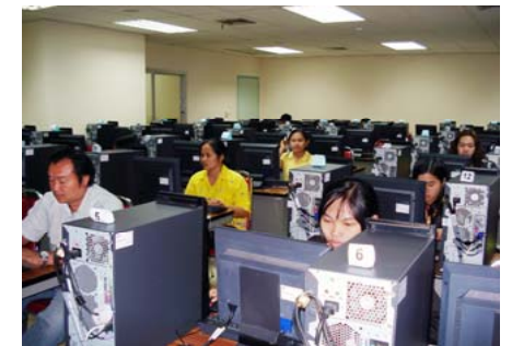
ผู้เข้าร่วมอบรมการใช้โปรแกรมระบบ สารสนเทศงานคลังของ อบต.