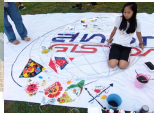
ตกแต่งว่าธีออส