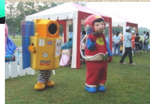
ที่ธีออส กับ ที่จิสต้า ทักทายผู้มาร่วมงาน