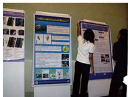
ภาพการนำเสนอผลการดำเนินงานของ ศูนย์ภูมิภาคเทคโนโลยีอวกาศฯ ภาคเหนือตอนล่าง