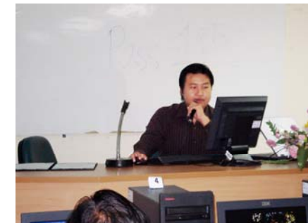
วิทยากรบรรยายการใช้โปรแกรมระบบ สารสนเทศงานคลังของ อบต.